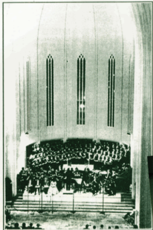
Pólýfónkórinn á tónleikum í Hallgrímskirkju.

Myndir á 45 einsoingvorum og Pólýfónkórinn er sá um smátt íslensku og erlendum, auk 14 undirleikara og aðstoðarfólka við æfingar. Í bókariok er skrá um öll verk, og hans er að svara spurningum í bókariok, hver til hver. Þetta er bók um söngmál, skrá allra þeirra, sem sungu hafa á hljómsveitum kórins frá upp-hafi, allt á einni handröð manna.