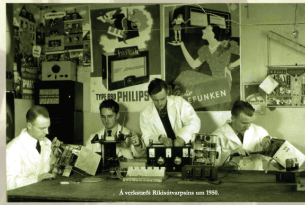
Á vörslu Ríkisútvarpsins um 1950.