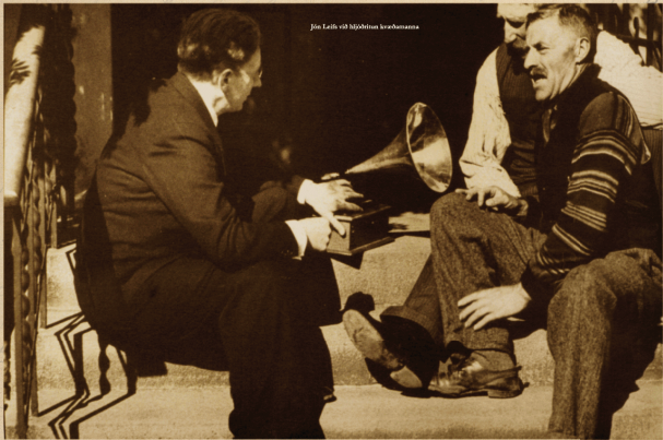
Jón Leifs við hljóðritun kvæðanna

Í safni Jóns Leifs eru samtals 76 vaxhólkar. Á þeim er varðveitt fjölbreytt og mjög merilegt efni, meðal annars fágætar hljóðritanir með íslenskum tvísnálgögum og tvísnálgæstum. Hljóðritasafn Jóns Leifs er varðveitt á tveimur stöðum, frumrit vaxhólkanna eru á safni í Berlín en afrit af þeim í Þjóðminjasafni Íslands.