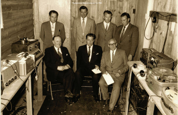
Takningum Ríkisútvarpsins um 1960.