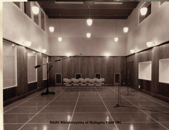
Stúdíó Ríkisútvarpsins að Skúlagötu 4 árið 1961.