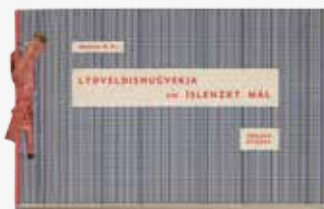
1944, Lýðveldishugvekja um íslenskt mál, Meistari HH. [Hallbjörn Halldórsson prentari].

Á sýningunni er lögð áhersla á að sýna forsögu bókverksins í samspili við tilraunir listamanna með bókarformið. Verkin eru sótt í safnkost Landsbókasafns Íslands – Háskólabókasafns og eru