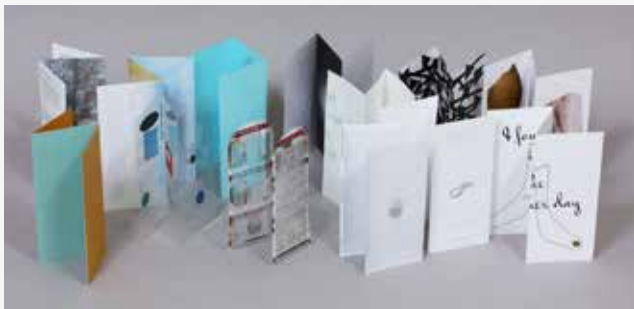
2018, bæklingar frá sýningunni „Bæklingar“ sem haldin var í sýningarrýmiinu Open, Grandagarði.