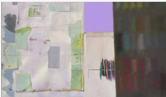
2016, Eygló Harðardóttir – Sculpture .

Á meðan á Listahátíð í Reykjavík 2018 stendur verður sýning á bókverki Eyglóar Harðardóttur Sculpture og verður frumgerð verksins sýnd í Lestrarsal Safnahússins dagana 7.–17. júní 2018.