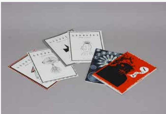
2015–2017, Listvísi málagn um myndlist.

Bókverkið virkjar bókina sem grip þar sem lesandinn heldur á henni og flettir – vegur og metur. Við lestur bókverka upplifir lesandinn hreyfingu, endurtekningu og festu allt í senn, upplifun þar sem öll skilningarvitin eru virkjuð. Lesandinn finnur áferðina og snertinguna við pappírinn, lyktina og samtvinnun myndar og texta – allt er þetta sú saga sem aðeins bókverk getur sagt.