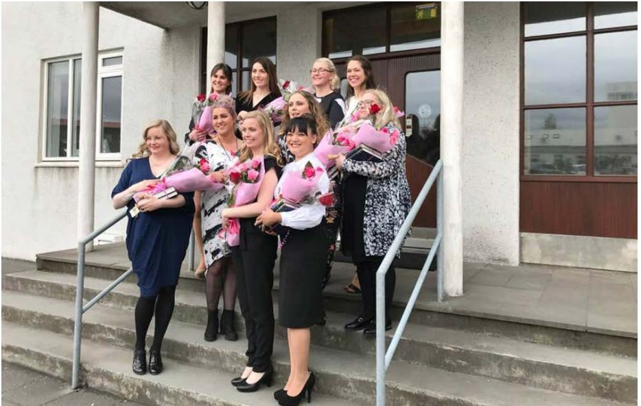
20. útskriftarhópur ljósmeðra frá Háskóla Íslands, 2018.

Frá 2003 hefur Ljósmeðrafélagið rekið fræðsluvef fyrir verðandi foreldra og aðstandendur. Á vefnum er fjölbreytt fræðsluefni með áreiðanlegum upplýsingum um þætti er varða meðgöngu, fæðingu og sængurlegu. Einnig eru starfrækt fræðsluöppin Ljósan og Fylgjan.