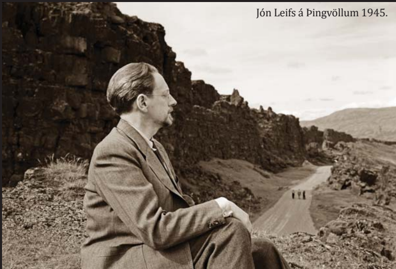
Jón Leifs á Þingvöllum 1945.