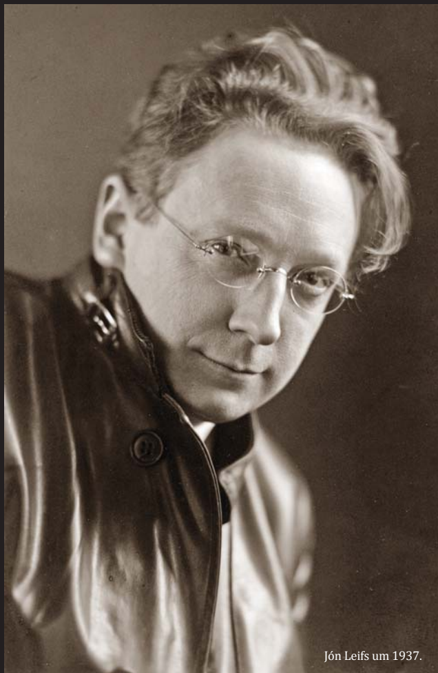
Jón Leifs um 1937.

Tónsmíðar Jóns nutu vaxandi vinsælda í Þýskalandi við upphaf fjórða áratugarins. Einfaldari þjóðlagaútsetningar hans voru sérlega vinsælar og Rímnadanslög in op. 11 voru fyrsta verk hans sem gefið var út á hljómplötu. Árið 1933 komu út hjá forlaginu Kistner & Siegel í Leipzig öll þau tónverk sem Jón hafði samið fram að þeim tíma, og vöktu þau yfirleitt hrifningu gagnrýnenda. Á þessum árum fæddist einnig hugmyndin að stærsta verki Jóns, Eddu-óratoríunum , og hann lauk við fyrsta hluta verksins ( Sköpun heimsins ) árið 1939. Jón leit á tónlist sína sem tilraun til að endurreisa norræna listsköpun á grunni íslenskrar fornmenningar og hann ritaði bókina Íslands künstlerische Anregung (Listræn köllun Íslands), þar sem hann viðrar hugmyndir sínar um eiginleika og sérstöðu norrænnar menningar.