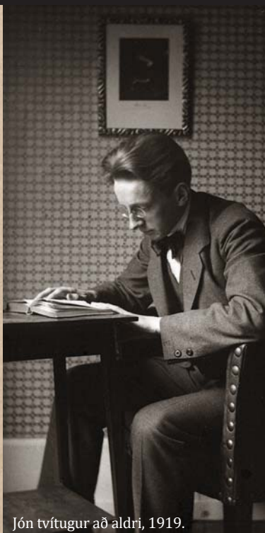
Jón tvítugur að aldri, 1919.

Hindun heitir með mönnum, en hlýrnir með gobum, kalla vindófná vanlr, upphelm jötunr, alfar fagarastf, dverggar drjúpannal.