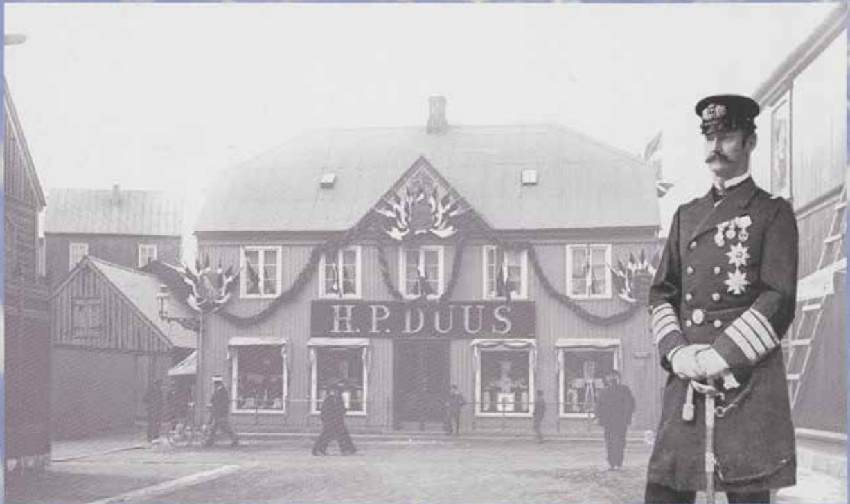
Heimsókn Friðriks VIII Danakonungs til Íslands 1907

„Aukinn skilning mun hún færa oss, þessi Íslandsferð“