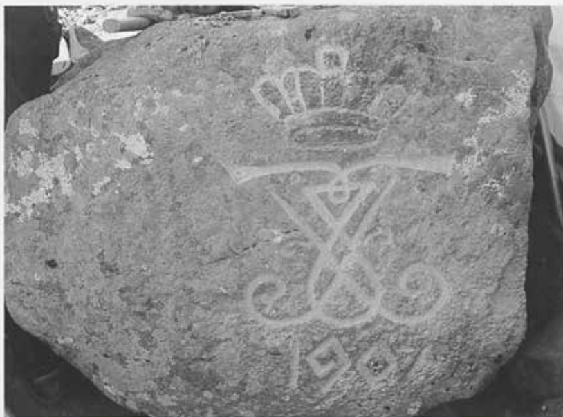
Steinn Friðriks VIII.

Matthías Jochumsson hafði tal af þeim feðgum báðum: „Ég átti tal við þá báða konungana, Kristján 9. og Friðrik 8. bæði erlendis og hér á landi og má því trútt um tala. Kristján var hnifréttur hermaður og „aristokrat“ að eðli, en enginn andans maður ... stírdur til máls og eins og óvanur að mæla margt við eða umgangast alþýðufólk. Sonur hans aftur á móti var öðlingur í lund, vel menntaður og málsnjall og svo auðveldur og aðlaðandi, sem „formið“ ýtrast leyfði.“ 2