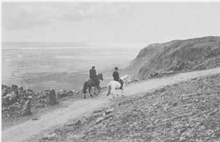
Hannes Hafstein og Friðrik VIII á Kambabrún.