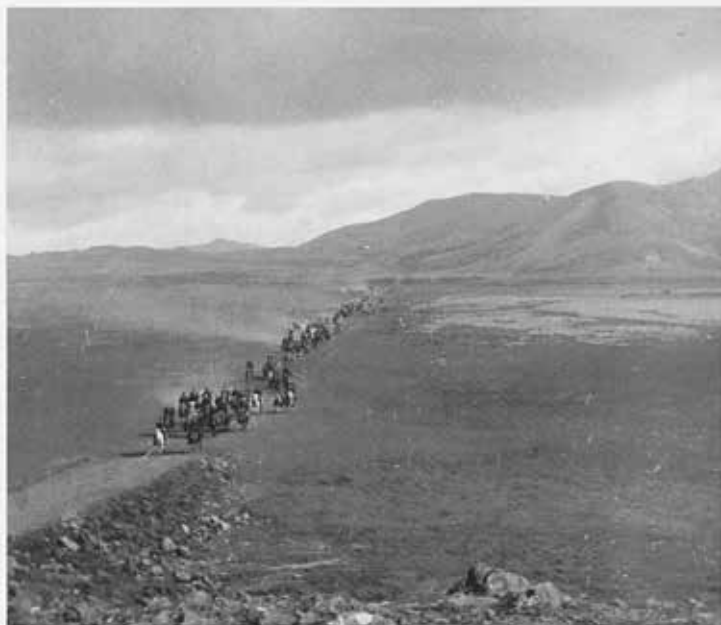
Konungsfylgdin ríður um Laugarvatnsvelli.

vallarhrauni, er nú urðu að þola hinn brennandi sólarhita við erfiða vinnu, en ég gat notið góðviðrisins á hinn þægilegasta hátt.