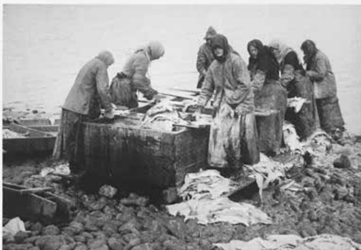
Konur vaska fisk á Bildudal kringum aldamótin 1900.

þótti reyndar nóg um og bentu á að ekki sæmði að sýna þau flegulæti sem ýmsir voru taldir hafa sýnt af sér, þar á meðal þingmenn. Aðrir átöldu alþýðuna fyrir álappalega framkomu. Blaðið Reykjavík, sem fylgdi ferðum konungs vel eftir, sá ástæðu til þess að setja ofan í við landsmenn: „Annars kunnir fólk sig lítt þar sem konungur fór hjá, konur stóðu eins og dæmdar og karlmennirnir að vanda þegjandi með höndur í vösum. Er það ljótur siður og leiddinlegur.“ 9