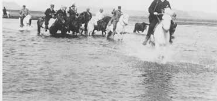
Ríðið yfir Laxá.

Árið 1881 hóf félagið Messrs R. & D. Slimon áætlunarsiglingar á hálfsmánaðar fresti milli Leith og Reykjavíkur á sumar- og haustmánuðum. Þessar siglingar voru fyrst og fremst ætlaðar þeim vaxandi fjölda Íslendinga sem fluttist til Norður-Ameríku, en skipin fluttu einnig fólk af öðru þjóðerni til og frá Íslandi á sanngjörmu verði. Árið 1883 komu skipin Thyra og Laura í staðinn fyrir Diana og Sameinaða gufuskipafélagið hélt einnig uppi áætlunarsiglingum milli Kaupmannahafnar og Reykjavíkur. Árið 1906 hafði Sameinaða gufuskipafélagið aukið þjónustuna og réð þá yfir fimm gufuskipum sem fóru þrjátíu ferðir á tímabilinu frá febrúar til desember. Skipin voru fremur lítil og tóku ekki fleiri en 30 farþega í einu, alla í káetum. Til samanburðar var Ophir, 7.000 tonna skemmtiferðaskip í eigu P & O Line sem sigldi fyrir Thomas Cook & Co. og hafði viðkomu í Reykjavík í þrjá daga í ágúst 1899, með 231 farþega um borð. Var þetta upphaf þróunar í ferðamannaþjónustu fyrir þá sem vildu fara á óvenjulega staði á norðurslóðum. Ári seinna kom systurskip Ophir, Cuzco, til