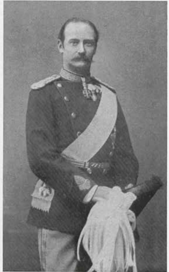
Friðrik VIII Danakonungur.

Kristján IX lést árið 1906 og sonur hans tók við. Friðriki VIII voru málefni Íslands kunnug og hann var Íslendingum velviljaður. Það sýndi sig í viðræðum hans og Hannesar Hafstein Íslandsráðherra stuttu eftir að hann var krýndur. Báðum var kappsmál að koma á gagnkvæmum skilningi á milli þjóðanna tveggja. Konungur vildi veita Íslendingum meira formlegt sjálfstæði svo að þeir gætu til frambúðar unað sambandinu við Danmörku. Fyrsta skrefið steig Friðrik VIII þegar hann ásamt ríkisstjórn og þingi bauð öllum alþingismönnum til Danmerkur sumarið 1906. Allir þingmenn, sem höfðu tók á, þáðu boðið eða 35 af 40. Í þingmannaförinni hófust óformlegar viðræður um samningagerð og umbætur á sambandi landanna. Konungur boðaði síðan komu sína og danskra ráðamanna til Íslands árið eftir.