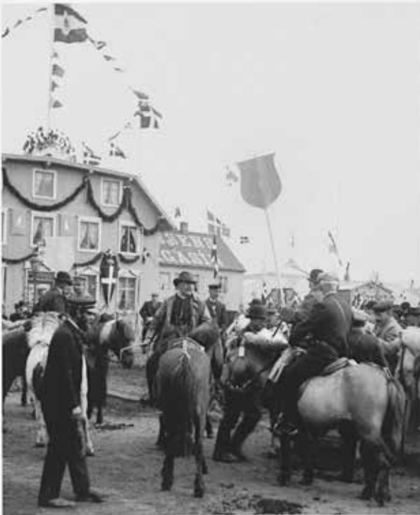
Ferðamenn leggja upp í austurför á hestum frá Lækjartorgi 1. ágúst 1907. Í baksýn er Thomsens Magasín fátum skrítt vegna komu Friðriks VII.

Ferð konungs og ríkisþingmanna til Færeyja og Íslands hófst stundvíslega kl. 2 eftir hádegi sunnudaginn 21. júlí þegar Birma, með konungsfánann við hún, og Atlanta, skip ríkisþingmanna, leystu landfestar við Kaupmannahöfn. Einnig lagði af stað beitiskipið Geysir sem fylgja skyldi konungsskipi. Annað beitiskip, Hekla, slóst í hópinn í Færeyjum. Í föruneyti konungs og Haraldar prins voru eins og áður sagði 40 ríkisþingmenn (í þeirra hópi var forsætisráðherra Dana, J.C. Christensen), blaðamenn og ýmsir tignar- og frammámenn í dönsku þjóðlífi.