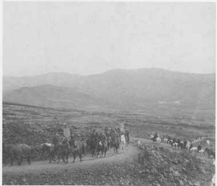
Konungsleiðangur fetar sig upp Kambana.

Þeir útlendingar, sem hættu sér út í misjöfn veður til að berja Ísland augum á seinni hluta 19. aldar tilheyrdðu sérstökum hópi. Ekki voru þeir endilega harðgerri en gestgjafarnir á Íslandi, en langflestir nutu þeir greinilega meiri forréttinda. Enginn ákvað upp úr þurru að leggja upp í Íslandsferð, og ferðin sjálf var langt frá því að vera ódýr. Hún útheimti mikinn undirbúning og ennþá meiri peninga. Hinn dæmigerði