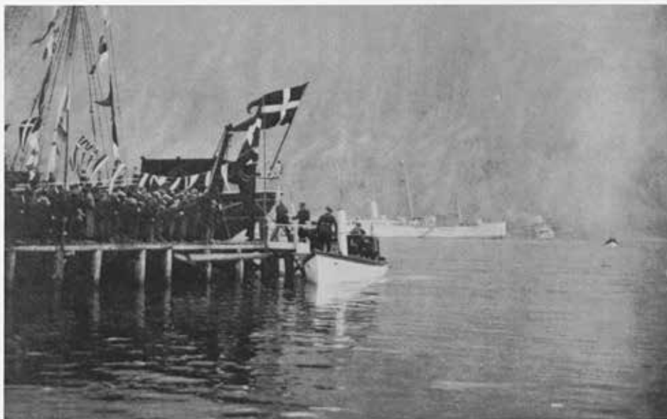
Konungur stígur á land á Seyðisfirði.