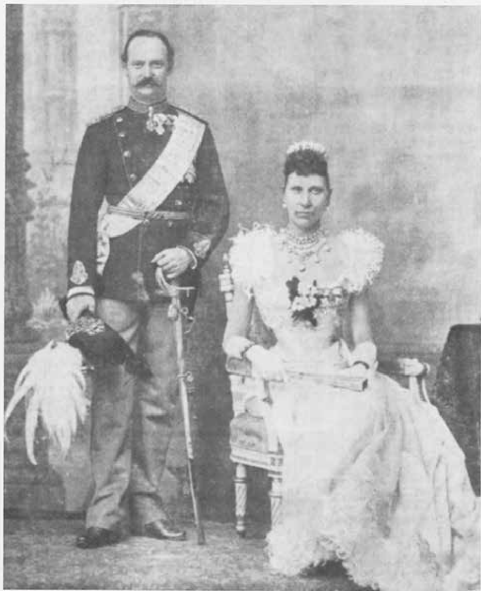
Friðrik VIII og Lovisa drottning.