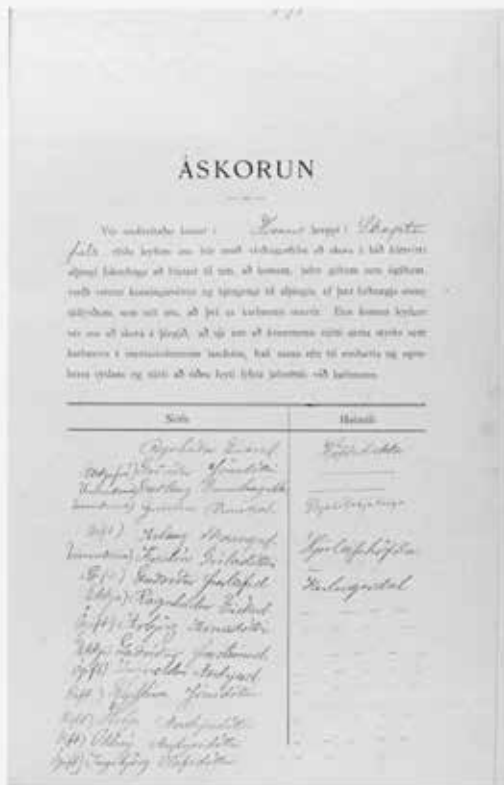
Konur fá jafurétti. Alþingissafn. Alþingismál 1907 II. Þjóðskjalasafn Íslands.

Í stuttu máli sagt þá hafði myndast í landinu á árinu 1907 víðtæk samstaða um réttindi kvenna og þótti nú bæði sjálfsagt og eðlilegt að