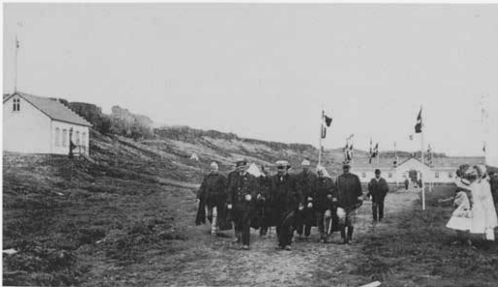
Konungur gengur til Lögbergs. Í baksýn má sjá konungsbústað og gildaskálan.

Við Geysi í Haukadal hafði stór skáli verið reistur handa ríkisþingmönnum inni á miðju hverasvæðinu. Aðeins ofar bjuggu konungur og Haraldur prins í minna húsi. Stórt tjald fyrir veisluhöld var á flötinni hjá Geysi, ekki langt frá sjálfum skálarbarminum.