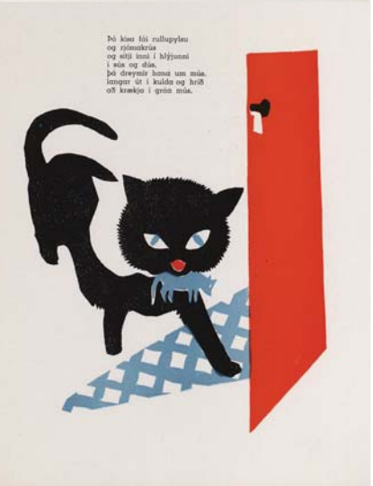
Kötturinn sem hvarf sem kom út 1947 hefur notið hvað mestra vinsælda af bókum Nínu.